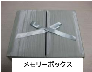
メモリーボックス