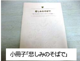
小冊子「悲しみのそばで」

http://plaza.unin.ac.jp/artemis/rcdnp/tenshi/ceremoneycard.html