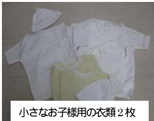
小さなお子様用の衣類2枚