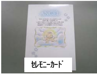
セレモニーカード

http://plaza.unin.ac.jp/artemis/rcdnp/tenshi/ceremoneycard.html